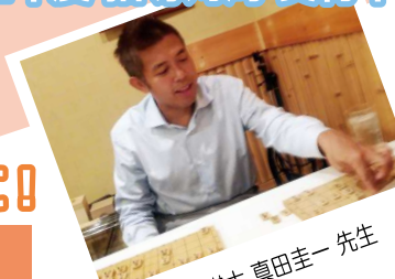
プロ棋士 真田圭一先生