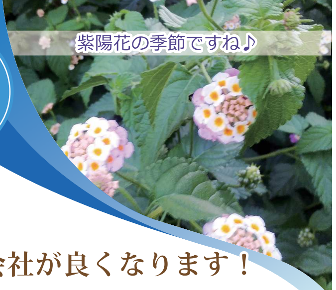
紫陽花の季節ですね♪