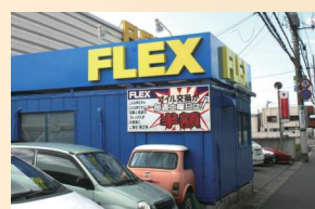
千葉市稲毛区長沼原町 774-1

TEL 043-257-5285 email: service@flexauto.co.jp フレックス稲毛民間車検工場