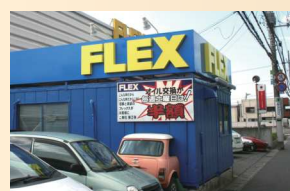
千葉市稲毛区長沼原町 774-1

TEL 043-257-5285 email: service@flexauto.co.jp フレックス稲毛民間車検工場