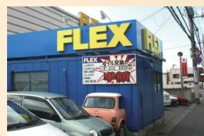
千葉市稲毛区長沼原町 774-1

TEL 043-257-5285 email: service@flexauto.co.jp フレックス稲毛民間車検工場