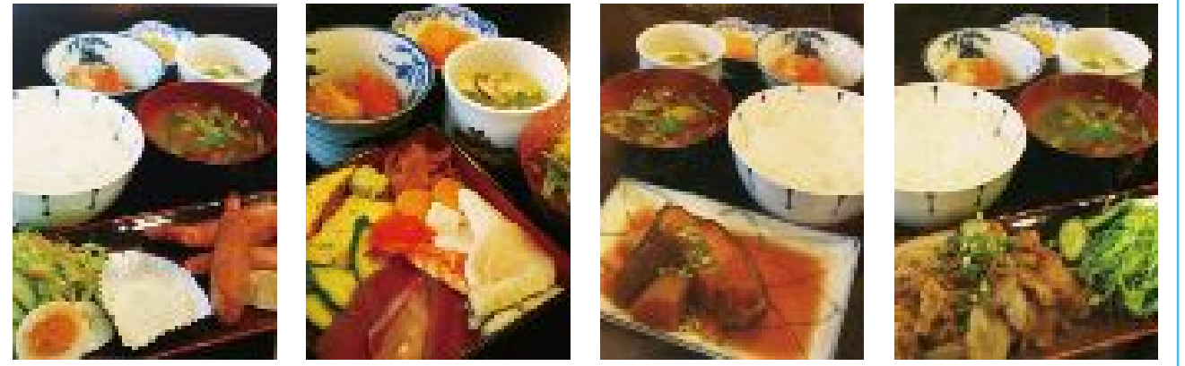
エビフライ 780円 ちらし 980円 煮魚 880円 生姜焼き 780円

ネタは築地直送、味に自信あり 寿司は 鮭や直人！ 日替わりで毎日4種類！お昼の定食始めました！