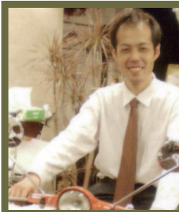
監督： しげちゃん いどばた稲毛代表 将棋倶楽部24 4段

美味しい料理・酒・将棋の優雅な日曜日！ 世代を超えた友達ができる！ 来月も来たくなる！